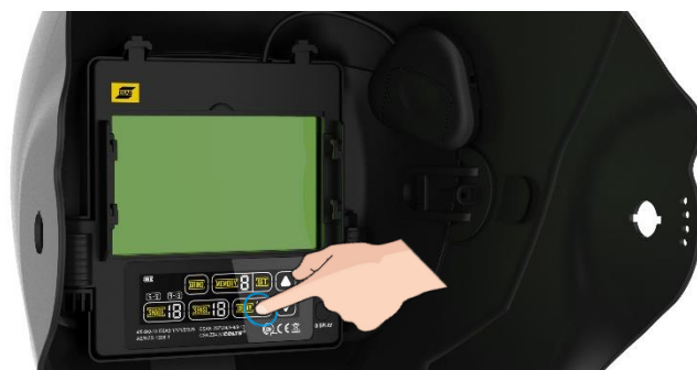
ADF di classe ottica elevata, con interfaccia touchscreen a colori