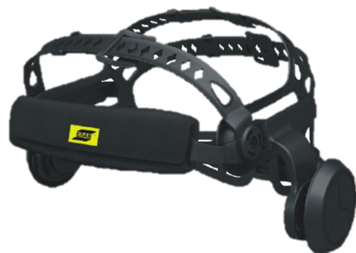
Caschetto interno comfort Halo™ (vista frontale)

Per maggiori informazioni, visitare esab.com .