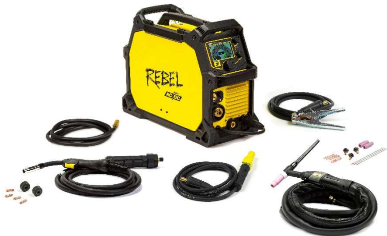
Rebel™ EMP 205ic AC/DC e accessori.

Abbiamo reso possibile l'impossibile con la prima macchina multiprocesso portatile, dotata di capacità MIG, filo animato, MMA, TIG DC e ora anche TIG AC. Questo vuol dire che salda in TIG anche l'alluminio. Si tratta di un VERO sistema di saldatura all-in-one che offre le migliori prestazioni della sua categoria in ogni processo, racchiuse in un package industriale robusto, portatile, in grado di andare ovunque e saldare qualsiasi materiale.