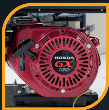
Motore Honda GX 160