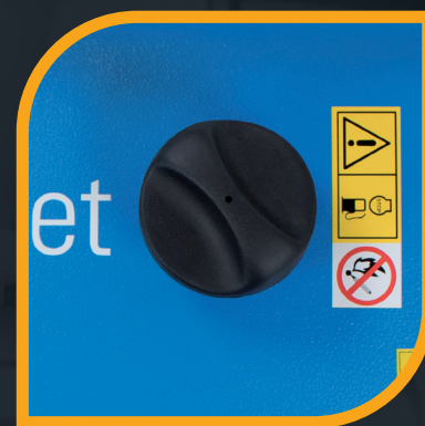
Serbatoio da 11 lt