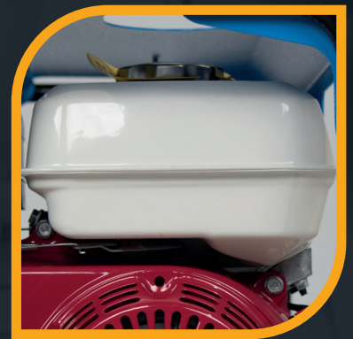
Serbatoio da 3,1 Lt