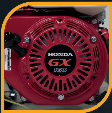
Motore Honda GX 160