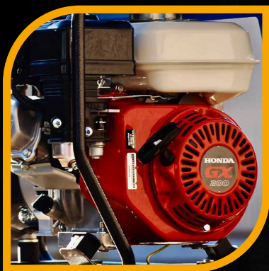
Motore Honda GX200