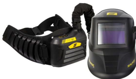
EPR-X1 con maschera di saldatura Savage A40 Air