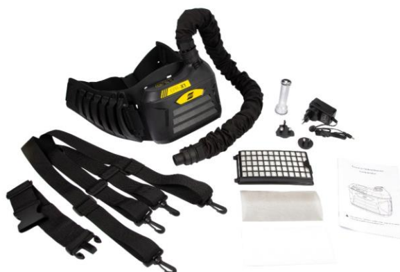
Sistema EPR-X1 PAPR

Visita esab.com per ulteriori informazioni.