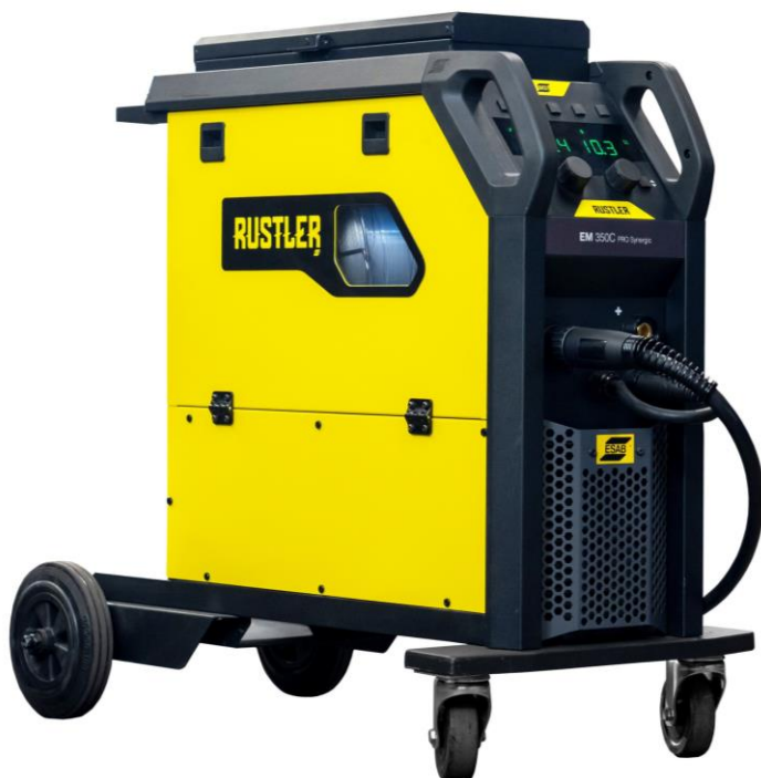
Rustler EM 350C PRO Synergic

Le saldatrici a inverter Rustler MIG PRO Compact sono la soluzione ideale per le sfide di saldatura più comuni. Dotate della più moderna tecnologia ad inverter, combinano bassi consumi energetici con prestazioni in saldatura ottimizzate.