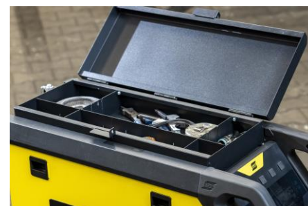
Cassetta attrezzi opzionale per gli accessori, nella parte superiore