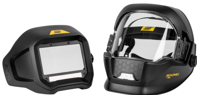
Sentinel A70 Pro con ADF rimovibile

Visita il sito esab.com per ulteriori informazioni.