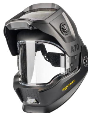
Sentinel A70 Pro